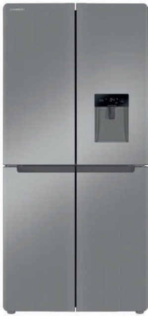
■ سفید ■ نقره ای مات ■ استیل ■ تیتانیوم