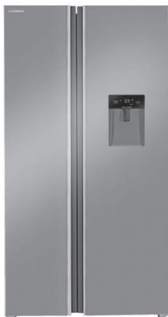
سفید ■ نقره ای مات ■ استیل ■ تیتانیوم