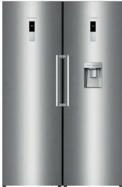
■ سفید ■ استیل