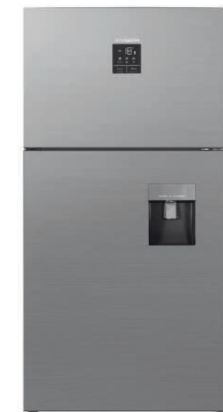
سفید ■ نقره ای مات ■ استیل ■ تیتانیوم